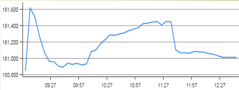
نمودار روزانه شاخص